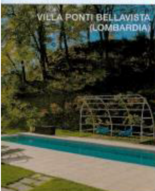
VILLA PONTI BELLAVISTA (LOMBARDIA)