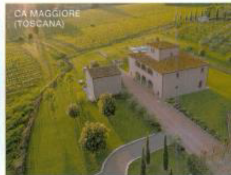
CA MAGGIORE (TOSCANA)