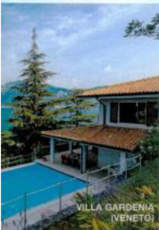
VILLA GARDENIA (VENETO)