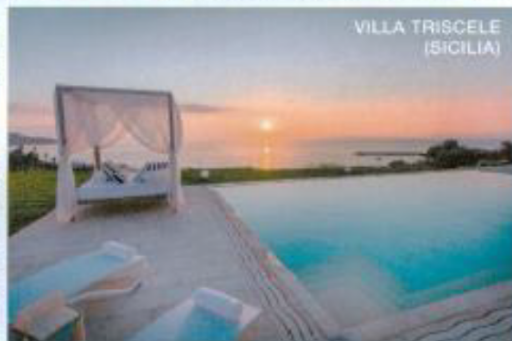
VILLA TRISCELE (SICILIA)