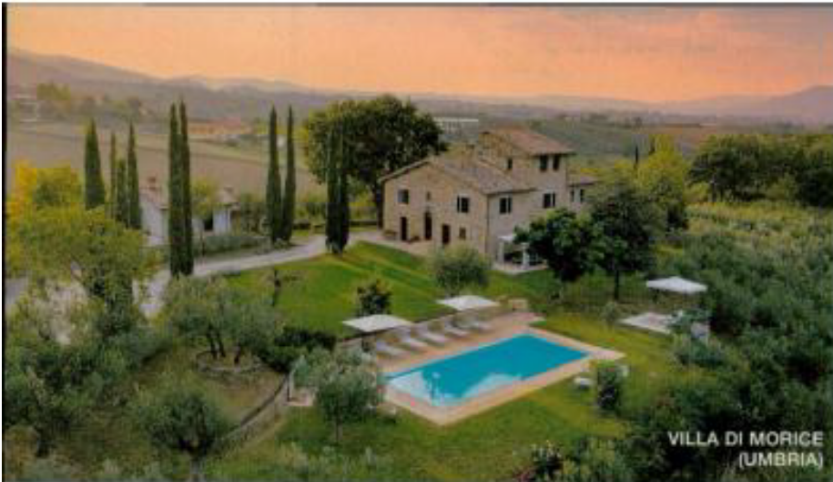
VILLA DI MORICE (UMBRIA)