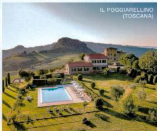
IL POGGIARELLINO (TOSCANA)